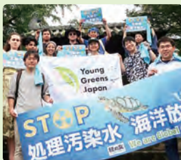
ヤング・グリーンズin松山