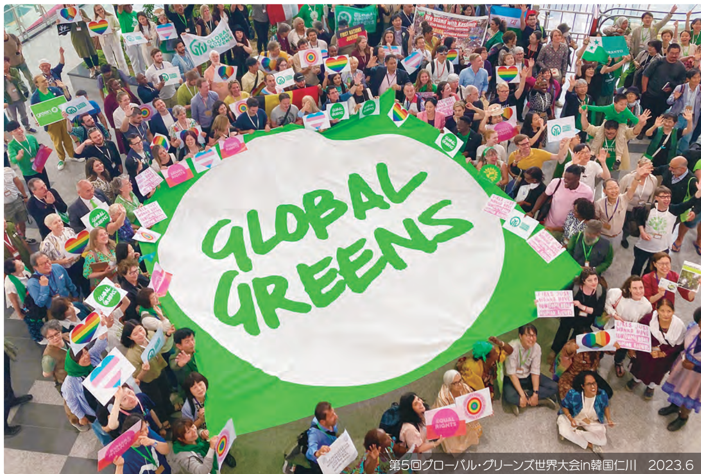
第5回グローバル・グリーンズ世界大会in韓国仁川 2023.6