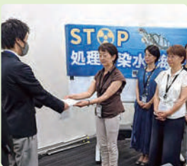
経産省・復興庁へ汚染水海洋放出中止を申し入れ