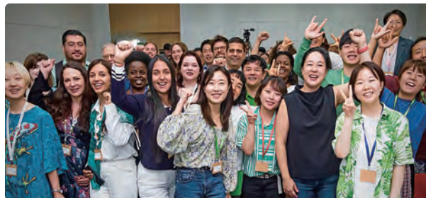
第5回グローバル・グリーンズ世界大会 in 韓国 分科会