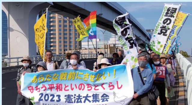
2023 憲法大集会(有明防災公園)参加者2万5000人

5月3日、全国各地で憲法集会が行われ、緑の党メンバーも参加しました。ウクライナの危機や中国・北朝鮮の「脅威」を理由に、岸田政権は「敵基地攻撃能力」保有などこれまでの「専守防衛」を完全に転換・逸脱する重大な内容となる「安保3文書」を閣議だけで決定し、これに基づき、大軍拡を推し進めています。憲法は今また大きな危機にさらされ、その理念は踏みにじられつつあります。