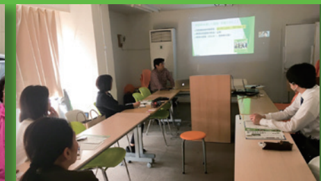
5/9 新人議員セミナーを開催し、東京会場とZOOMで23人が参加しました