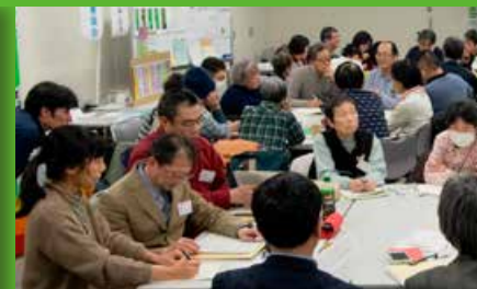
総会1日目、政治活動方針を深めるための「気候正義」と「社会的公正」の実現をめざすためのディスカッションタイム。テーブルに分かれて活発な議論が交わされた