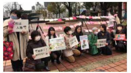
フラワーデモ名古屋

男女平等指数は世界121位と過去最低となった日本ですが、女性やLGBTQの人々を取り巻く状況が互いに連動しながら着実に前進し、若い女性たちが気候危機アクションをリードしています。緑の党は、この希望を確かなものにして、あらゆるSOGI（性指向と性自認）を認め合い、共生していく社会を創るために取り組みを進めます。