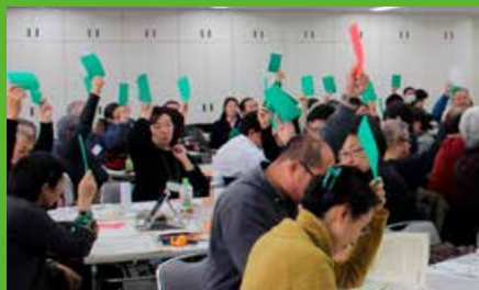
2/8-9東京品川の会場に全国から100人を超える会員・サポーターが集まり第9回定期総会を開催。運営委員会提出の議案が6つの修正案を受け入れて全て可決。採決は緑赤カードで