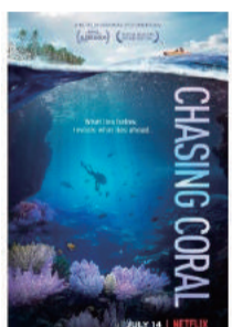
映画「チエイシング・コーラルー消えゆくサンゴ礁」2017年89分ドキュメンタリーNetflix。気候変動により枯れ果てゆくサンゴの姿の厳しい現実を映し出す

日本国内においても、気候変動の影響は農業に直接現れています。神奈川県や山梨県では野菜や果物の生産量や品質への影響が出ていると聞いています。