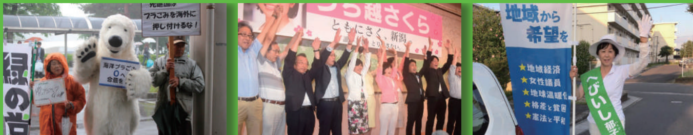
6/15 緑の党信州は白熊シロベエと「G20エネルギー・環境関係閣僚会合」の軽井沢へ。遊びにきていた子どもたちや海外からの観光客に「脱プラスチック社会にGO!」とアピール