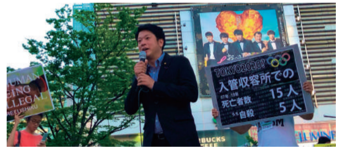
石川大我参議院議員8/4緊急アピール@新宿

石川議員をはじめ応援した国会議員とも連携して緑の社会ビジョン実現にむけて取り組みをすすめます。