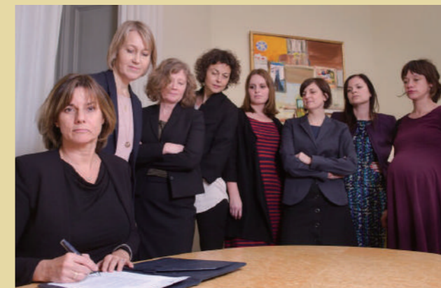
2017.2.3法案に署名するスウェーデン副首相イザベラ・ロヴィーンは緑の党共同代表。世界初のフェミニスト内閣!