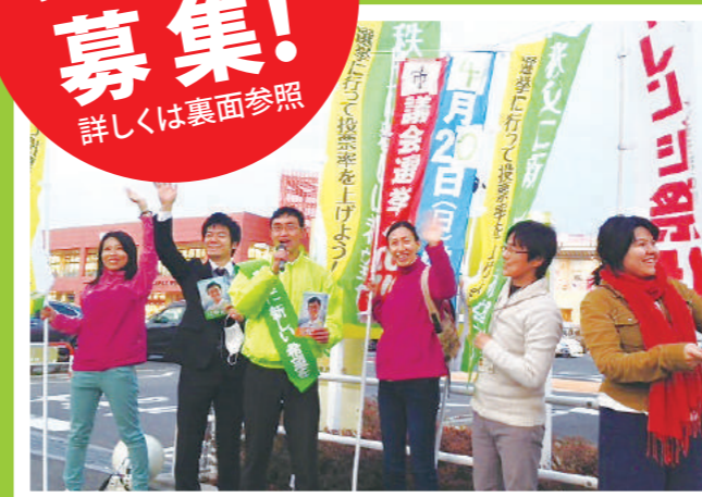
選挙スクールの仲間も駆けつけて初当選。

2019年の統一自治体選挙の年は、参院選の年でもあります。憲法「改正」が重要な争点として浮上するなか、今後の日本の行く末を左右する節目となる年です。