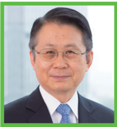
水野和夫さん 法政大学教授

元三菱 UFJ モルガン・スタンレー証券 チーフエコノミスト/民主党政権で内閣 官房内閣審議官など/「資本主義の終焉 と歴史の危機」がベストセラーに/新著 「閉じてゆく帝国と逆説の21世紀経済」